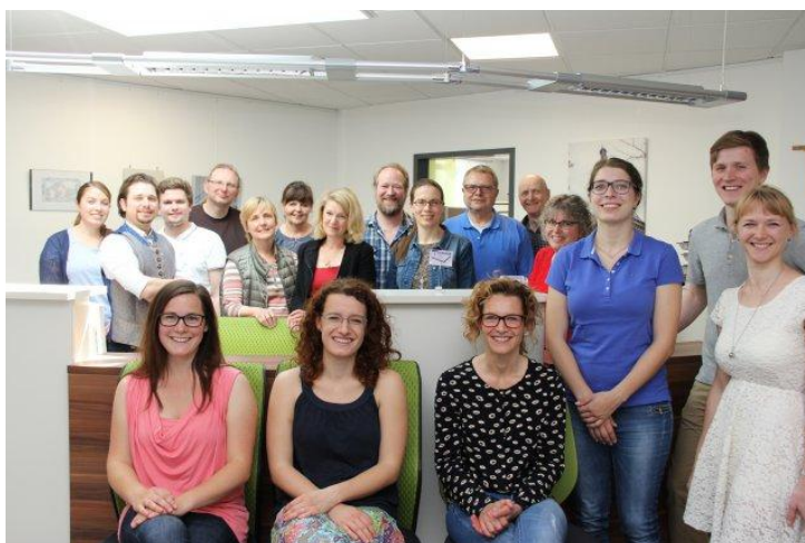
Bild: Neue Medizinstudierende haben ihre Ausbildung am Lehrkrankenhaus Dillingen begonnen und in der Praxis Dres. med. Münch und Roller ihre Mentoren getroffen.

Mittlerweile haben 44 Studierende inzwischen das studentische Ausbildungsangebot der medizinischen AKADemie Dillingen wahrgenommen. 21 bereits approbierte Ärzte werden aktuell in der medizinischen AKADemie Dillingen in fünf Jahren zu Fachärzten für Allgemeinmedizin weitergebildet. Die Hälfte arbeitet bereits in den Arztpraxen des Landkreises. Und acht davon hatten schon das Praktische Jahr (PJ) ihres Medizinstudiums im Ausbildungsprojekt Dillingen absolviert.